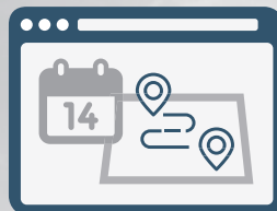
Planificación de Viaje